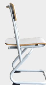
DS 0204 Dim. (cm): 40x37x31-38