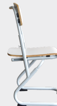
DS 0406 Dim. (cm): 44x40x39-46