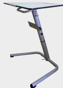
ONE R1 Dim.(cm): 50x87x60-75

DIMENSÕES E ACABAMENTOS | DIMENSIONES Y ACABADOS